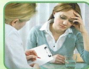
дети и взрослые с хроническими заболеваниями