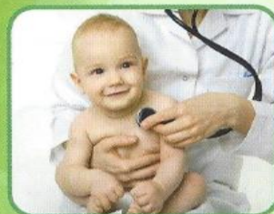
дети младше 5 лет